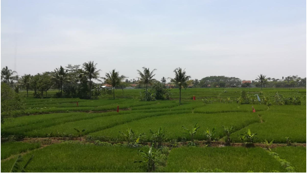
Reisfelder vom Zug aus Richtung Purwokerto