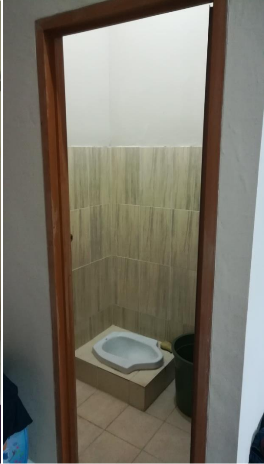
Zimmer im Studentenwohnheim