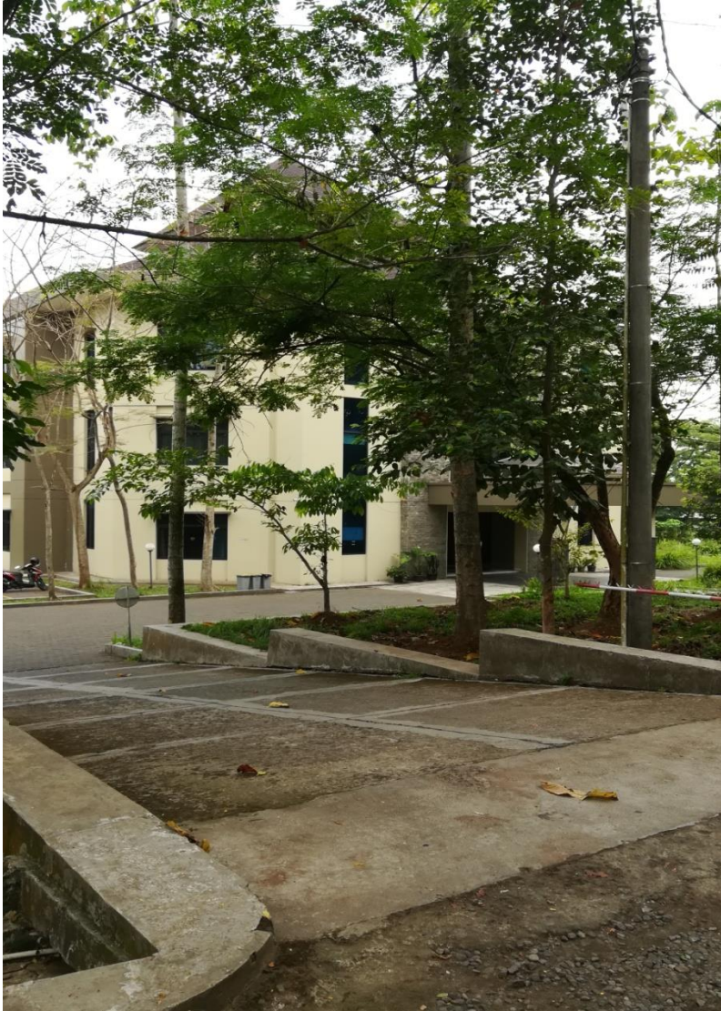
Blick aufs Biologie Labor