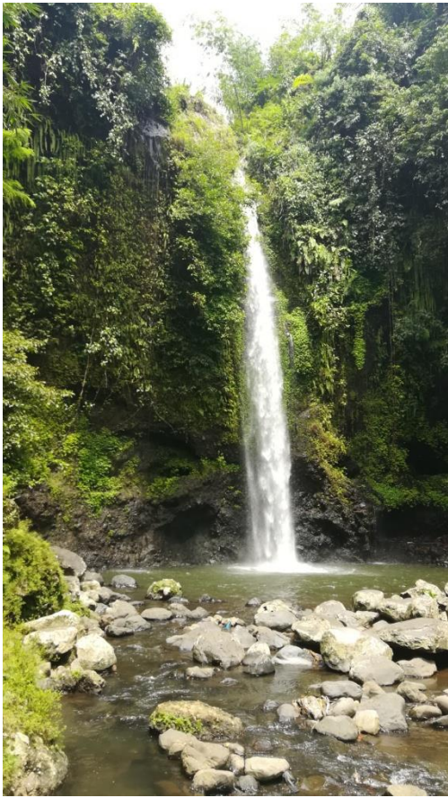
Wasserfall, nur 15 Minuten Fahrt vom Campus entfernt