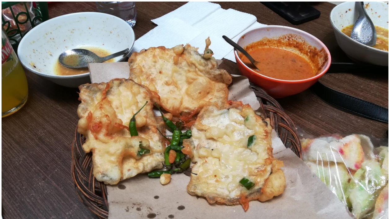
Purwokerto's Spezialität – Mendoan (frittierter Tempeh mit Chilis)

Trotz viel Reiseerfahrung in meinem bisherigen Leben fiel es mir schwer, mich an Purwokerto zu gewöhnen. Für längeren Aufenthalt empfiehlt es sich auf jeden Fall etwas Indonesisch zu lernen, da Kommunikation auf Java sonst oft ein Problem ist. Allerdings sind die indonesischen Studenten an ausländischen Studenten sehr interessiert und man wird immer offen und freundlich empfangen.