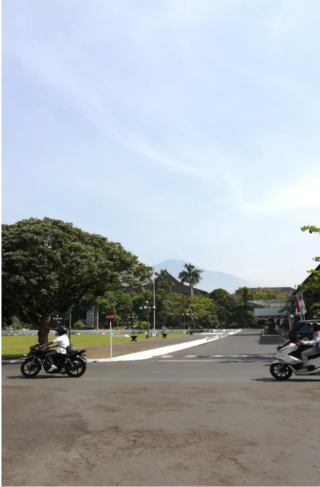
Blick auf Gunung Slamet vom Campus