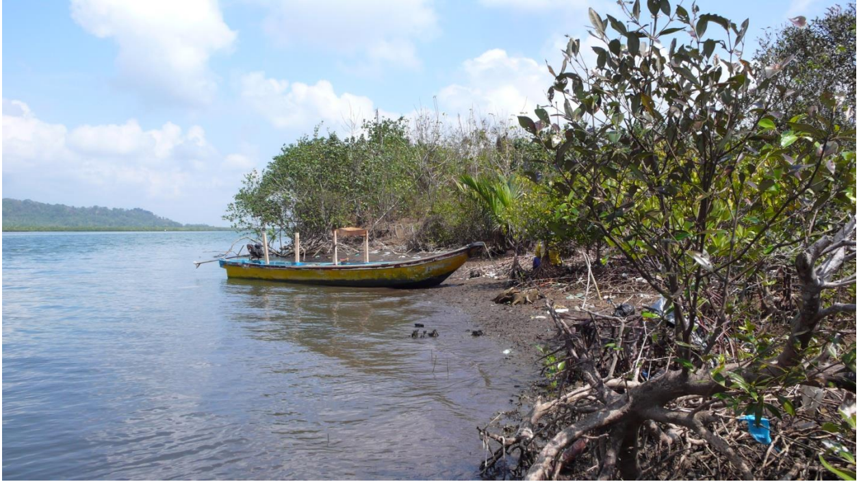
Mangroven in Cilacap