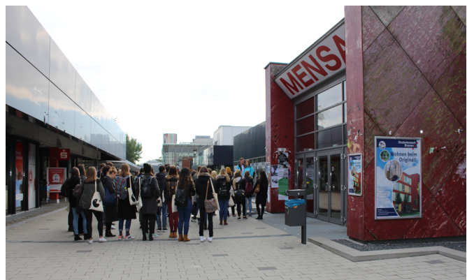
Vorstellung der Mensa beim Rundgang durch die Bremer Uni.