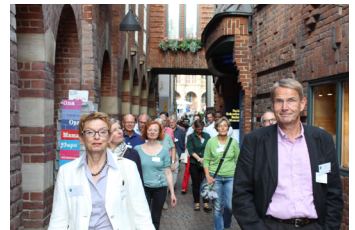
Impressionen aus der Böttcherstraße.

Lab) und das Roboterweltmeister-Team B-Human. Wie üblich endete die Veranstaltung mit einem geselligen Get-Together bei Wein und Brezeln. Die Alumni tauschten sich über den erlebten Abend aus. Im Allgemeinen war zu hören: Es seien erstaunliche Fortschritte mit klaren