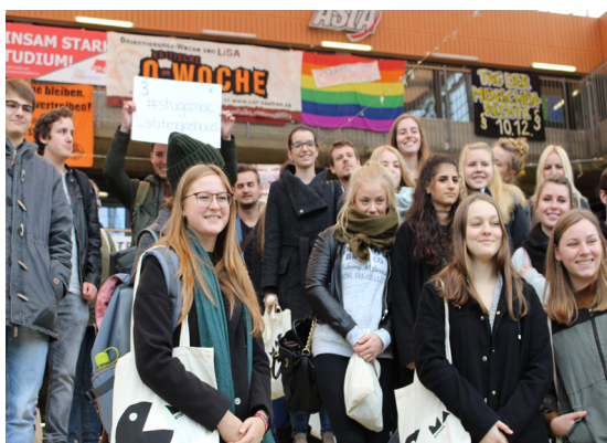
Ein Teil der neuen KMW-Studierenden in der Glashalle.

Wir wünschen allen Neuankömmlingen einen guten Start in das Studentenleben! /WB