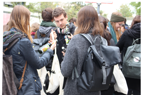
Es gibt bunt gefüllte Jutebeutel für die Ersties.

auch Studierende aus den höheren Semestern gesellen: Die Kneipentour durch das Bremer Viertel. Hier zogen unzählige Kleingruppen von etwa 20 Personen durch Bremens Kneipen und genossen das Nachtleben der Stadt in vollen Zügen.