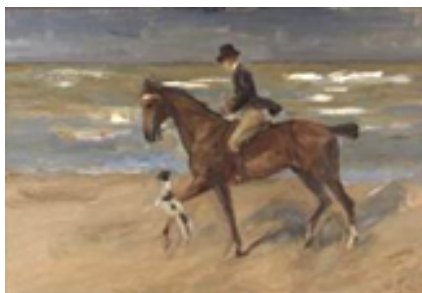
© VG Bild-Kunst, Bonn: Max Liebermann, Reiter am Strand mit Foxterrier, 1911, Öl auf Leinwand, 70 x 100 cm Nationalmuseum Stockholm

Danach wird es wie gewohnt ein entspanntes Get-Together geben, diesmal in einer nahegelegenen Gastronomie. Achtung: Die Veranstaltung ist bereits ausgebucht. Es sind allerdings noch Wartelistenplätze zu ergattern.