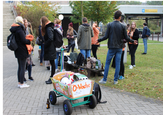
BWL-StuGA mit Bollerwagen.

Am Donnerstag fand dann ein altbekanntes Highlight der ersten Uni-Woche statt, zu dem sich meist