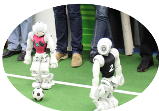
Fußball-Robos in Aktion.